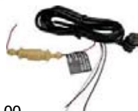
010-10082-00 Câble d'alimentation/NMEA