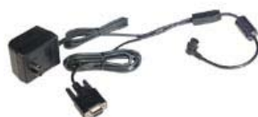
010-10277-01 Bloc d'alimentation 220V avec interface PC