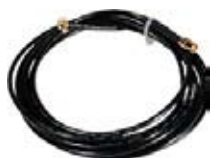
010-10157-00 Câble d'extension pour antenne GPS GA25 MCX