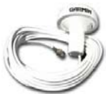
010-00174-00 Antenne GPS GA29 (nécessite l'adaptateur BNC/MCX 010-10121-00)