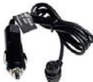
010-10085-00 Cordon allume-cigares