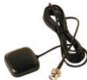
010-10702-00 Antenne GPS