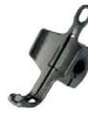
010-10454-00 Etrier guidon