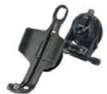
010-10455-00 Support marine