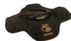
010-10306-00 Support antidérapant