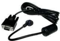
010-10141-00 Câble interface PC