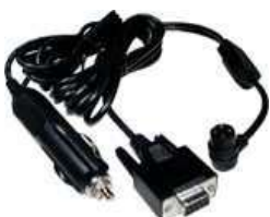
010-10165-00 Câble interface PC + cordon allume-cigares